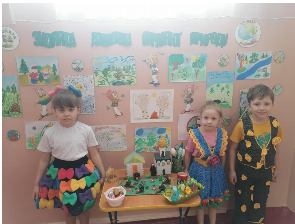
Выставка поделок из бросового материала «Планета чистая моя!»

Мероприятия проходили весело, интересно, а главное познавательно. Только совместными усилиями мы сможем сделать нашу планету чище и краше!